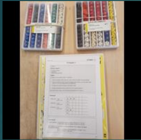
Problemløsning med terninger