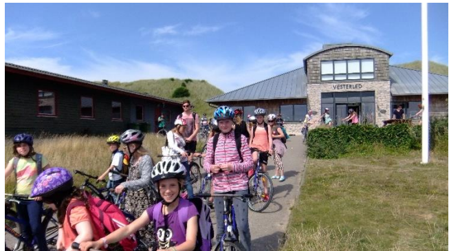
Lejrskolene Vesterled: 100 meter fra Vesterhavet

Mødet mellem jævnaldrende nord og syd for grænsen giver stor værdi til begge parter, derfor ønsker Dansk Skoleforening for Sydslesvig, at fælles lejrskoleophold i endnu højere grad end før kommer i fokus. Dansk Skoleforening for Sydslesvig driver lejrskolene Vesterled ved Hvide Sande. Ønsket er, at mindretalsskolerne hyppigere end tidligere deler stedet med skoler fra Danmark, så eleverne får det eftertragtede udbytte af at lege og have det sjovt med hinanden. Hvis din skole har en lejrskole, som det ønsker at besøge sammen med en klasse fra Sydslesvig, er vi også meget interesseret i det.