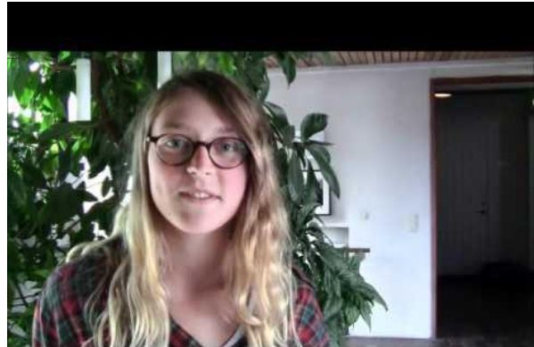
Elevambassadørerne er helt almindelige gymnasieelever, der vokser op i det danske mindretal i Sydslesvig eller det tyske mindretal i Sønderjylland.

Elevambassadørerne involverer klassen, når de tematisk kredser om emner som mindretal, identitet, kulturmøde, fjendebilleder, fordomme m.v. I kan få besøg af Elevambassadørerne i forbindelse med flerfaglige forløb, f.eks. almen studieforberedelse og i rene faglige forløb i historie, samfundsfag og tysk.