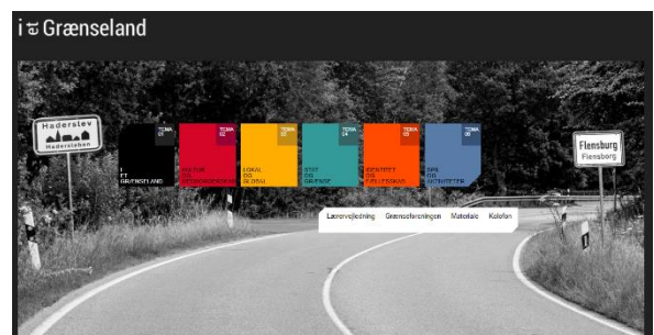
Faglige udfordringer og moderne pædagogik: www.ietgrænseland.dk