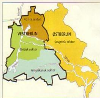
Berlinmuren blev bygget rundt om Vestberlin.