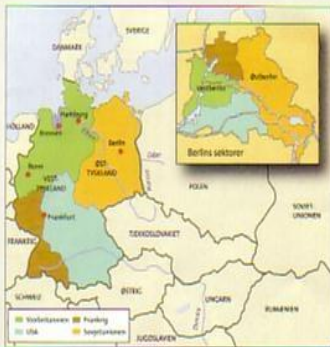
Tysklands besættelseszoner og Berlins sektorer.

I 1961 byggede myndighederne i DDR en mur rundt om Vestberlin. De to kilder giver hver deres forklaringer på, hvorfor muren blev bygget.